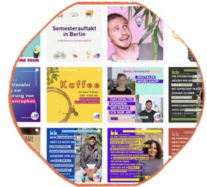
Social Media Kommunikation