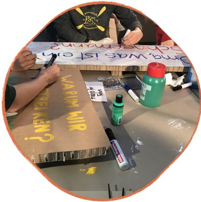
Events und Workshops