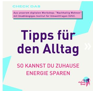
Tipps für den Alltag